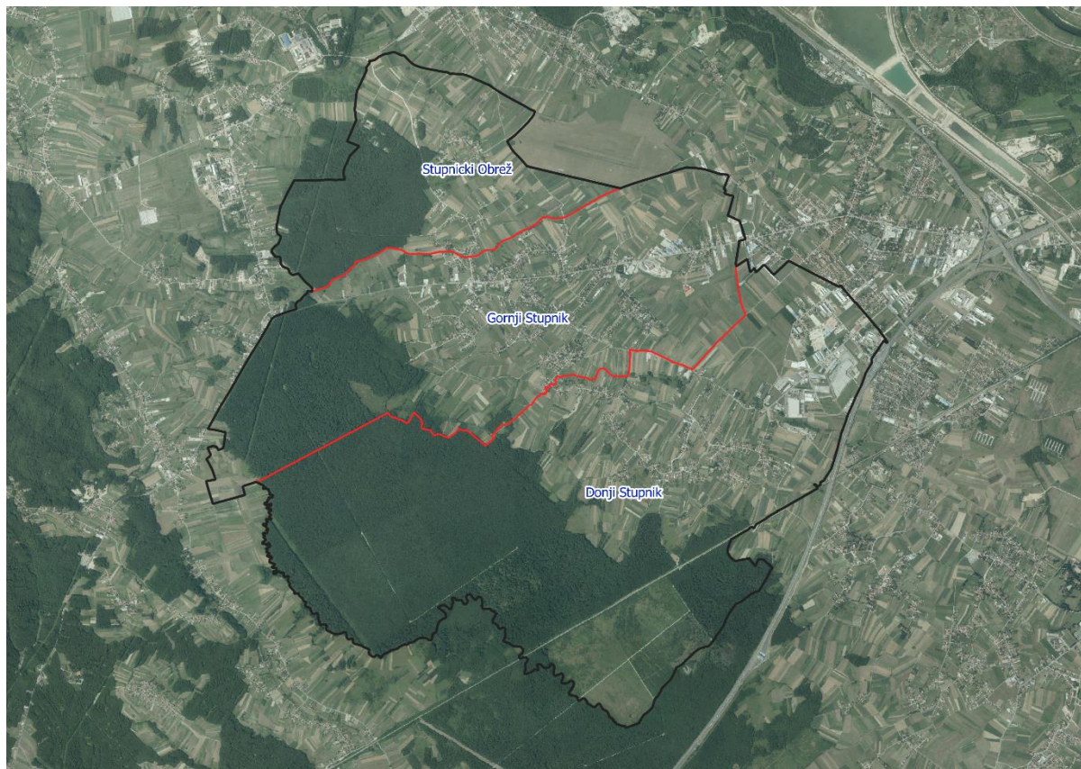
Slika 1: Naselja općine Stupnik, Izvor: Državna geodetska uprava - obrada autora

Općina Stupnik prostire se na površini od 24,8436 km 2 i sastoji se od 3 naselja: Donji Stupnik, Gornji Stupnik i Stupnički Obrež, prikazanih na slici 1.